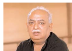
रविवार देर रात दिल का दौरा पड़ने से उनकी मौत हो गई। राना पिछले कई दिनों

संवाददाता लखनऊ। मशहूर शायर मुनवर राना का निधन हो गया है। रविवार देर रात दिल का दौरा पड़ने से उनकी मौत हो गई। राना पिछले कई दिनों से लखनऊ के पीजीआई में भर्ती थे। मशहूर शायर मुनवर राना का निधन हो गया है।