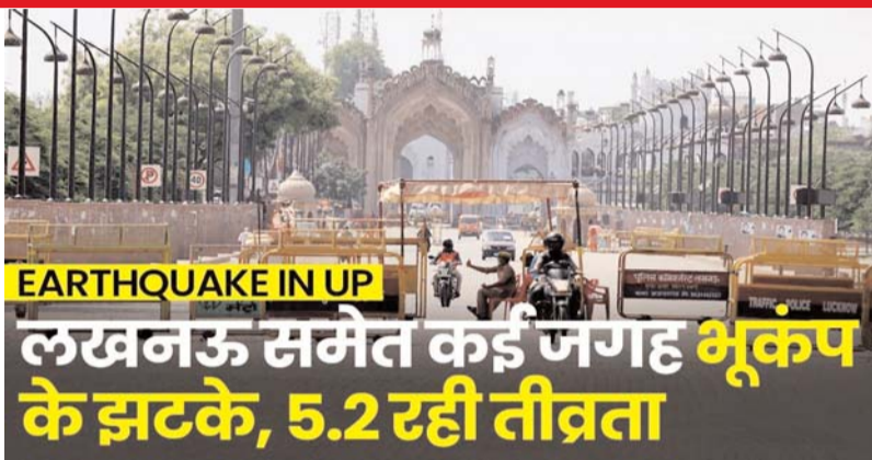
बार झटके आए। भूकंप का केंद्र नेपाल बताया गया है। अभी आ

लखनऊ। शुकुवार की रात करीब साढ़े 11 बजे लखनऊ और उसके आसपास के जिलों में भूकंप के झटके महसूस किए गए। झटके इतने तेज थे कि लोग घरों से बाहर निकल आए। दो तीन मिनट के भीतर यह झटके कई बार आए। बदहवासी में लोग घरों से बाहर निकले। लखनऊ से सटे हुए बाराबंकी, रायबरेली, सीतापुर आदि में भी भूकंप महसूस किया गया। इन जिलों में भी दो से तीन