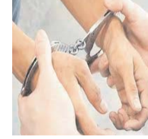
द अचीवर टाइम्स। रमेश चंद्र

लखीमपुर खीरी। पुलिस अधीक्षक खीरी के निर्देशन मे जनपद में अवैध शराब निष्कर्षण, बेचने व बनाने को रोकने का विशेष अभियान चलाकर कार्यवाही के पर्यप्रेक्ष्य में व क्षेत्राधिकारी के मार्गदर्शन मे चलाए जा रहे अभियान के क्रम मे आज दिन शुक्रवार को थाना फरधान पुलिस द्वारा 02 नफर अभि0गण को अलग-अलग स्थानों से कच्ची अवैध शराब बेचते हुए गिरफ्तार किया गया। जिसके संबंध में