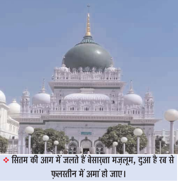
❖ सितम की आग में जलते हैं बैराता मजलूम, दुआ है रब से फलस्तीन में अमां हो जाए।