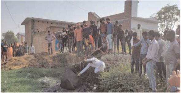
❖ पागल साड को 2 घंटे की कड़ी मेहनत के बाद पशु विभाग ने एकटा भेजा सुरक्षित स्थान आम लोगो ने ली राहा की सांस